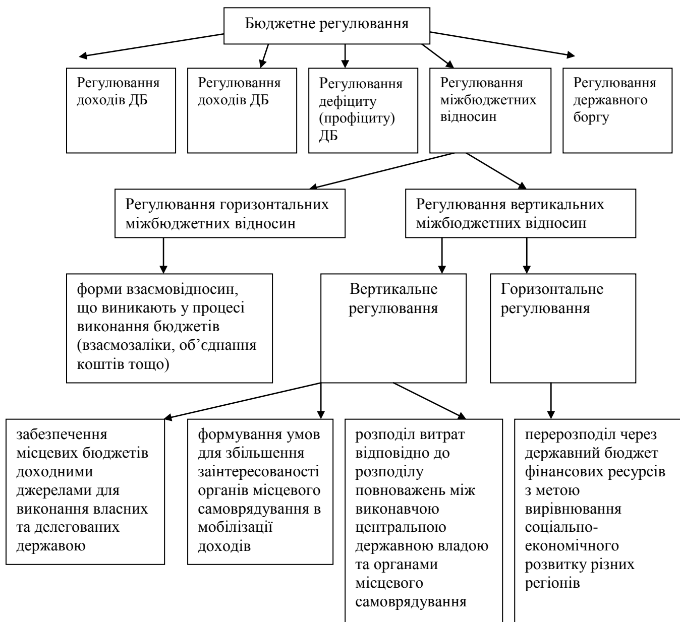
Рисунок 2 – Сутність регулювання міжбюджетних відносин

В узагальненому вигляді елементи бюджетного регулювання та регулювання міжбюджетних відносин представлено на рис. 2.